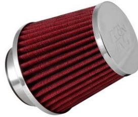
FILTRE A AIR