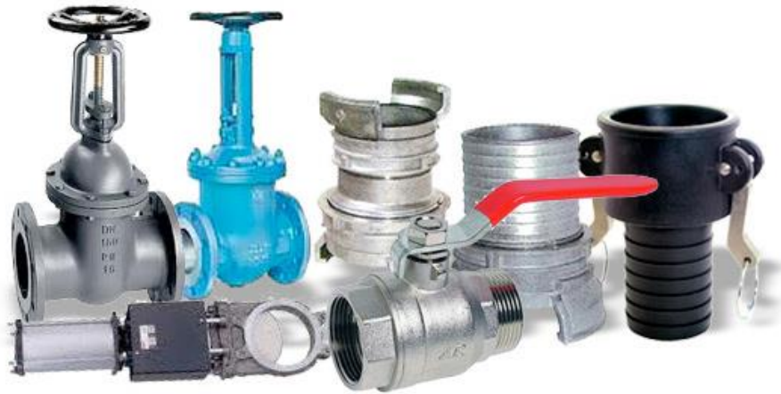
VANNES ET ROBINETS