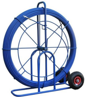
AIGUILLE DE TIRAGE