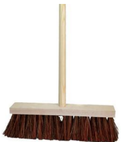
BALAI A MANCHE