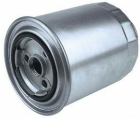
FILTRE A GASOIL