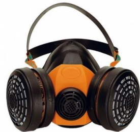
EPI VOIE RESPIRATOIRE