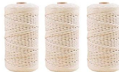
BOBINE DE COTON