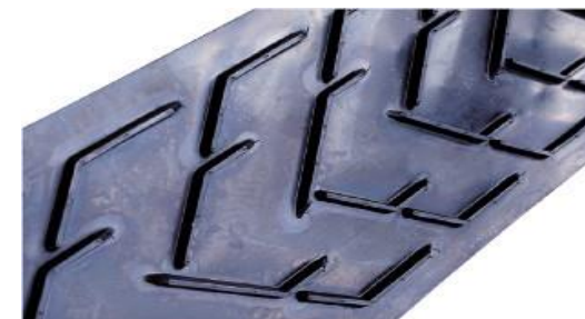
TAPIS DE TRANSPORT A CHEVRON