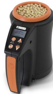
ANALYSEUR DE GRAIN D'HUMIDITES