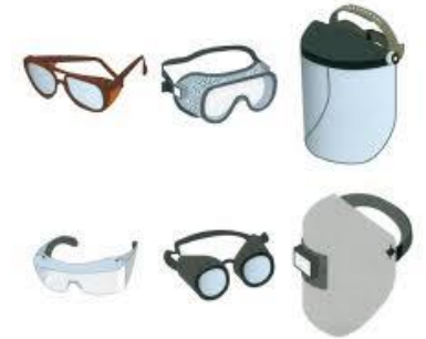
EPI POUR LESYEUX