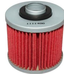
FILTRE A HUILE