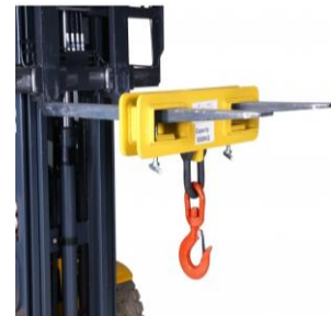
MATÉRIEL DE CHARIOT