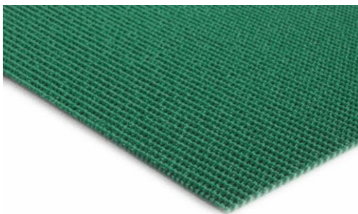
TAPIS DE TRANSPORT NID D'ABEILLE