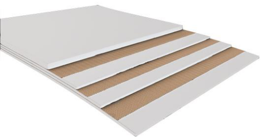
TAPIS DE TRANSPORT ALIMENTAIRE